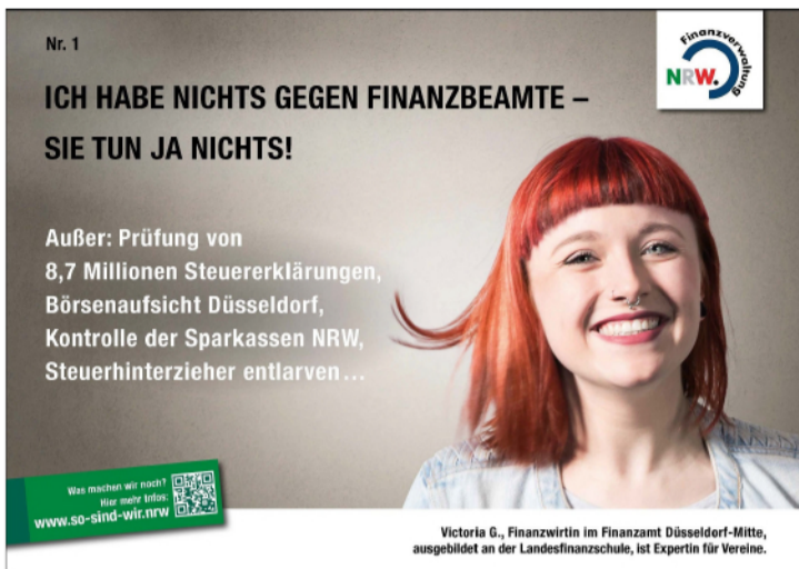
Das erste Kampagnenmotiv

Im Dezember 2016 rief das Finanzministerium des Landes NRW zu einer außergewöhnlichen Wettbewerbspräsentation auf: Eine Image-kampagne für den Berufsstand sollte entwickelt werden. Sechs Agenturen waren geladen - die KreativRealisten sicherten sich den Etat.